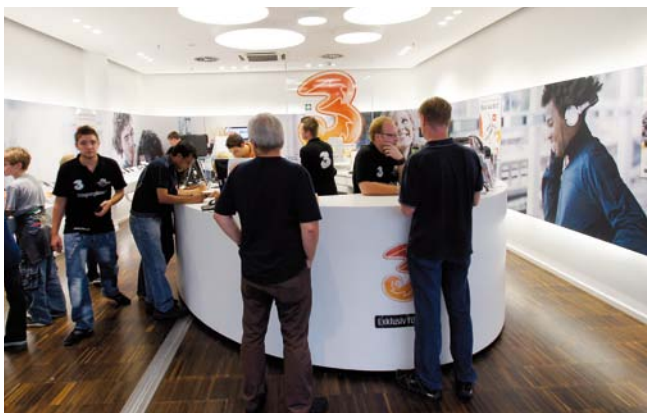
(上) 瑪利娜在奧地利已開設逾百分店。 (下) 3奧地利的創立，重塑當地電訊市場面貌。