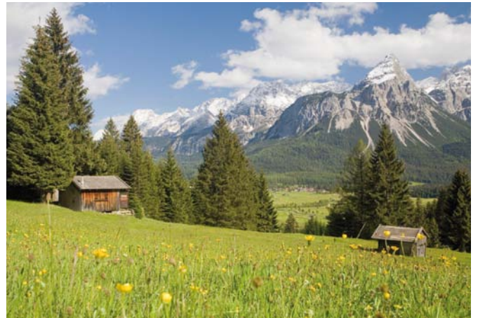
(上) 維也納的城市一覽。 (下左、右) 阿爾卑斯山的冬夏景緻。